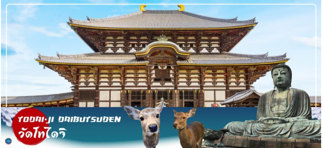
TODAI-JI DAIBUTSUDEN วัดโทไดจิ

วันที่สอง เมืองนารา – วัดโทไดจิ – สวนนารา – เมืองโอซาก้า – ศาลเจ้าสมิโยชิ ไทละ – ศาลเจ้านัมมะงะซากะ – ซุปป์ชินไซบาชิ